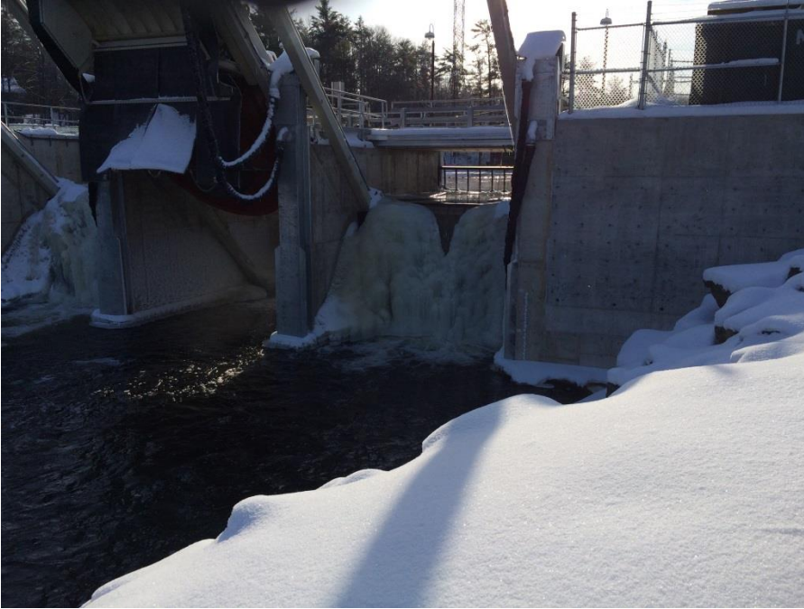
Photo 4 Accumulation de glace sur le côté en aval de la structure à turbines VLH MC

L'adaptation aux climats froids — Dans la photo ci-dessous, on voit l'accumulation de glace sur le côté en aval de la structure des turbines et des vannes de crête.