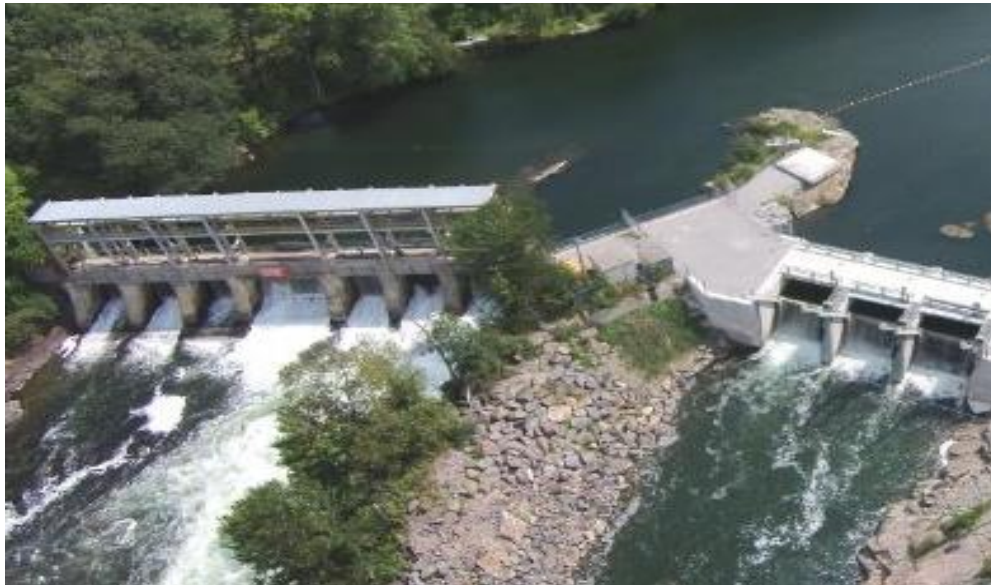
Photo 1 Le projet hydroélectrique des chutes Wasdell utilise la technologie au fil de l'eau pour produire de l'énergie propre

Projet de 495 MH Wasdell Falls Limited Partnership Washago (Ontario) 2016