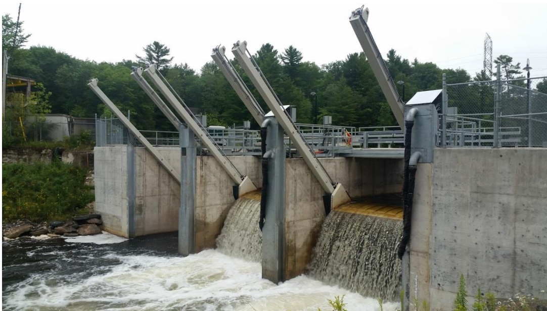
Photo 5 Les chutes Waddell en aval de la structure à turbines VLH MC