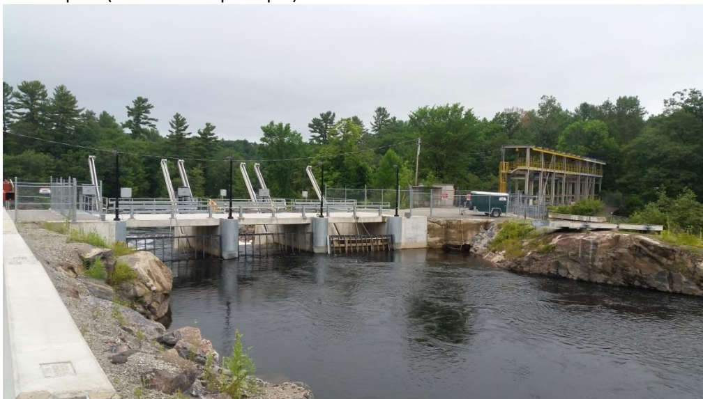
Photo 3 Bassin d'admission aux turbines VLH MC des chutes Wasdell

La photo ci-dessous présente le bassin d'admission aux turbines VLH MC ainsi que le barrage existant en arrière-plan (où on voit le portique).